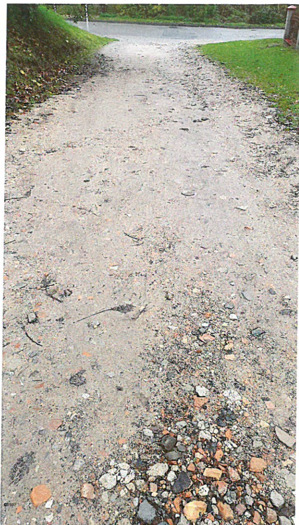
Ul. Żeglarska stan na dzień 5 listopada 2019 roku